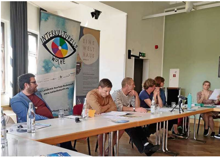
Zur Pressekonferenz des Weltsichten-Festivals ging es um dessen Höhepunkte.

Der Festivalfreitag beginnt unter anderem mit Schülervorträgen für gut 1000 Kinder und Jugendliche